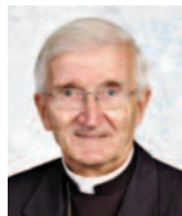
M gr Bertrand Blanchet Archevêque émérite, Rimouski