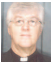
M gr Noël Simard Évêque auxiliaire de Sault-Ste-Marie, Ontario