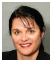
Hazel Markwell Centre for Clinical Ethics, Toronto