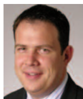
Eoin Connolly Centre for Clinical Ethics, Toronto