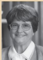
Helen Prejean, c.s.j. Son histoire est racontée dans le film « Dead Man Walking! » primé aux Oscars Nouvelle-Orléans, Louisiane